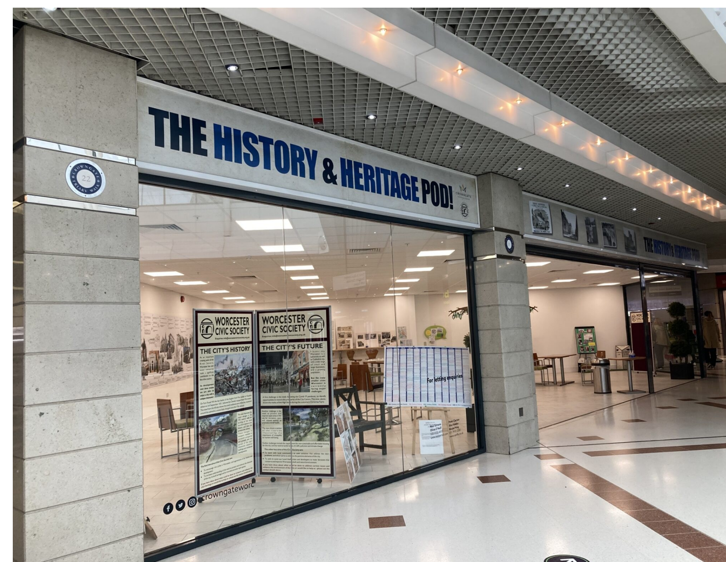
The History & Heritage POD! (Worcester Civic Society, 2021)

In de eerste plaats is het wijkcentrum een plek om vrijblijvend samen te komen. De tentoonstelling heeft daarbij een decoratieve functie, maar kan ook uitnodigen tot reflectie en dienen voor werving van nieuwe leden.