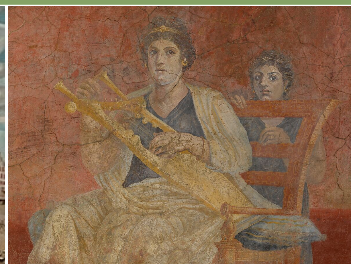
Left: De Lakenmarkt van 's-Hertogenbosch , ca. 1530, olieverf op houten paneel, Het Noordbrabants Museum, 's-Hertogenbosch Above: Wall painting from Room H of the Villa of P. Fannius Synistor at Boscoreale, ca. 50-40BCE, Fresco, The Metropolitan Museum of Art, New York Right: Wall painting fragment from the north wall of Room H of the Villa of P. Fannius Synistor at Boscoreale, ca. 50-40BCE, Fresco, The Metropolitan Museum of Art, New York

By Paula Hage, Student at Utrecht University