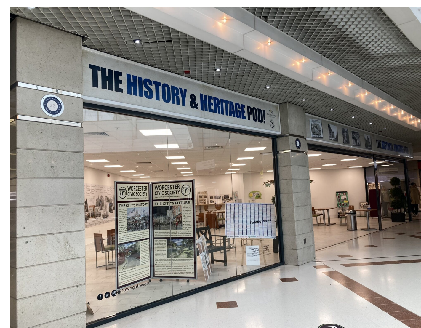
The History & Heritage POD! (Worcester Civic Society, 2021)

In the community centre, or in a shopping centre, there are yearly temporary exhibits about the Story of Rijnenburg. The Society organises these exhibits based on an aspect of local history. For this, the Society can count on support from Utrecht University. Through Community Engaged Learning students can help with the historical basis for these exhibits. Students from the Hogeschool voor de Kunsten Utrecht can help with design. Other heritage institutions of Utrecht can also help tell about local archaeology and can provide sources or objects for display. In the same way, Het Utrechtse Archief can offer visual sources for these exhibits. First and foremost, this place should be a place to come together for free. The exhibit has an illustrative function, but can also inspire reflection and lead to new members.